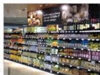
...neue kommerzielle Mediatheke, die Kaffee Tee und Nüsse feine anbietet.